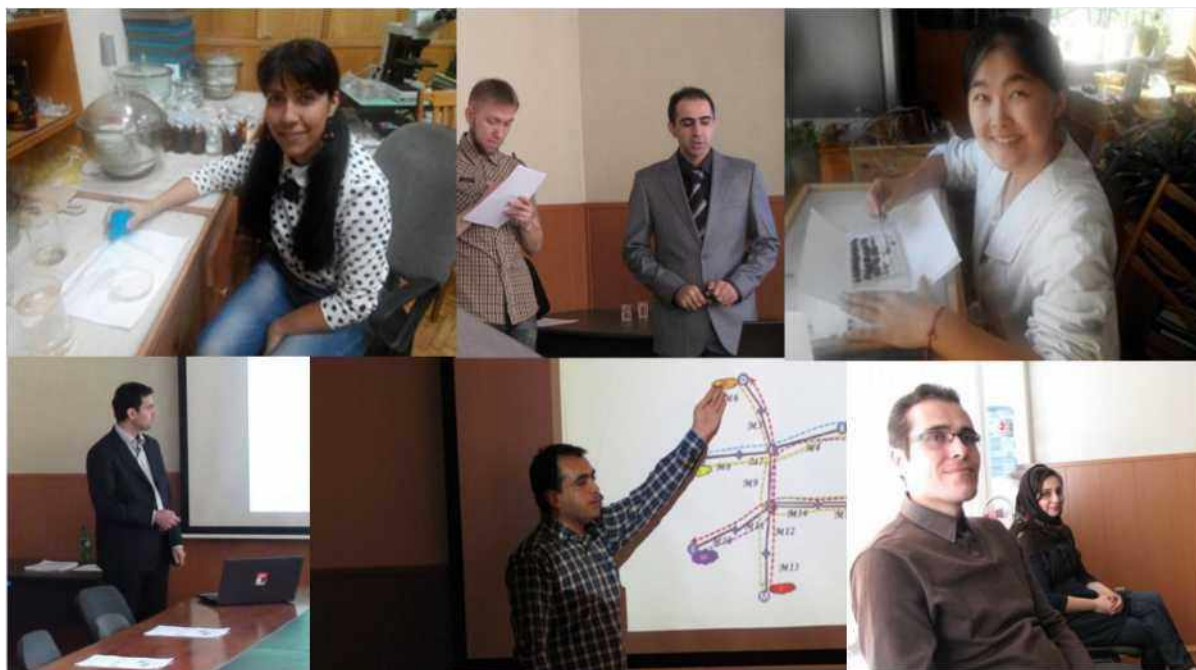
Аспиранты ГНУ «Институт физико-органической химии НАН Беларуси», ГНУ «Объединенный институт проблем информатики НАН (Беларуси)», ГНПО «Научно-практический центр НАН Беларуси по биоресурсам» из Исламской Республики Иран и Китайской Народной Республики

Научный руководитель консультирует аспиранта по вопросам планирования, организации и проведения научных исследований, оказывает ему помощь в освоении современных научных методов исследования, в подготовке и сдаче кандидатских экзаменов, оформлении публикаций, подготовке и представлении диссертации к предварительной экспертизе и защите, содействует обеспечению необходимыми материалами и оборудованием.