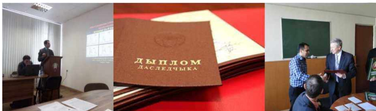
Защита кандидатской диссертации и вручение дипломов исследователя (ГНУ «Объединенный институт проблем информатики НАН Беларуси»)

Аспиранты, успешно освоившие содержание образовательной программы аспирантуры, получают квалификацию «Исследователь», а защитившим диссертацию присуждается ученая степень кандидата наук.