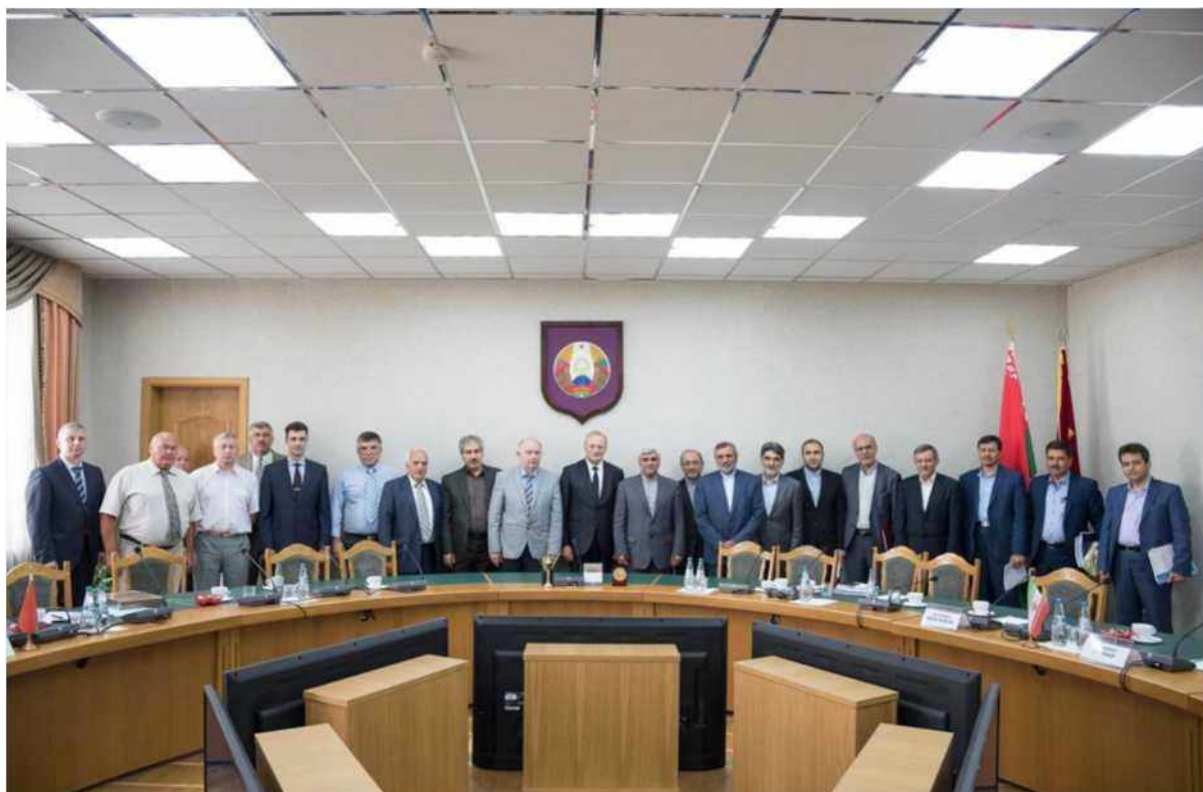
Встреча делегации Министерства образования, исследований и технологий Исламской Республики Иран во главе с Министром науки, исследований и технологий Мохаммадом Фархади в НАН Беларуси.

Национальная академия наук Беларуси развивает научное и научно-техническое сотрудничество, плодотворные деловые отношения с зарубежными партнерами во всем мире, в том числе по направлению подготовки научных работников высшей квалификации.